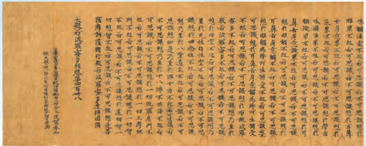
小川八幡神社経(巻438、奈良時代)

なかでも紀美野町の小川八幡神社には、奈良時代・平安時代の写本を多く含む貴重な大般若経が伝わっており、約4年間にわたる東京大学史料編纂所との共同調査によって、ようやくその全貌が判明してきました。この小川八幡神社の大般若経をはじめとして、和歌山県内に残された貴重な大般若経を紹介します。さまざまな災いを取り除くため、大般若経を入手して守り伝えてきた、きのくに—和歌山県の人びとの心に迫ります。