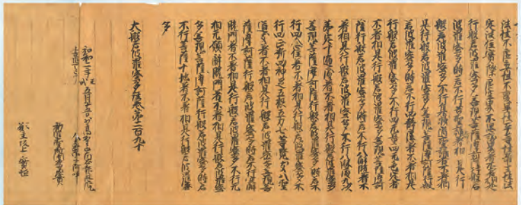
小川八幡神社経(巻290、南北朝時代)