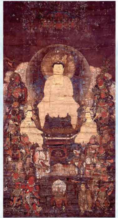
釈迦十六善神像(長保寺蔵)