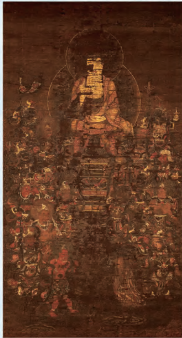
釈迦十六善神像(相賀八幡神社蔵)