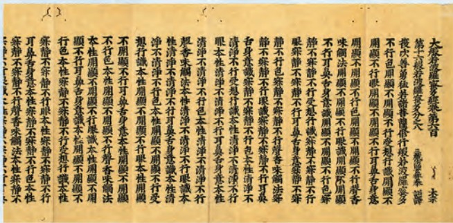
円通寺経(巻600、江戸時代)