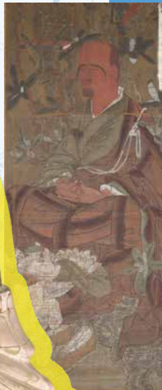
十六羅漢像(諸距離尊者) 浄教寺蔵(和歌山県指定文化財)