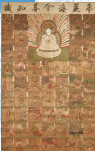
華嚴海会善知識曼荼羅 東大寺蔵(重要文化財)