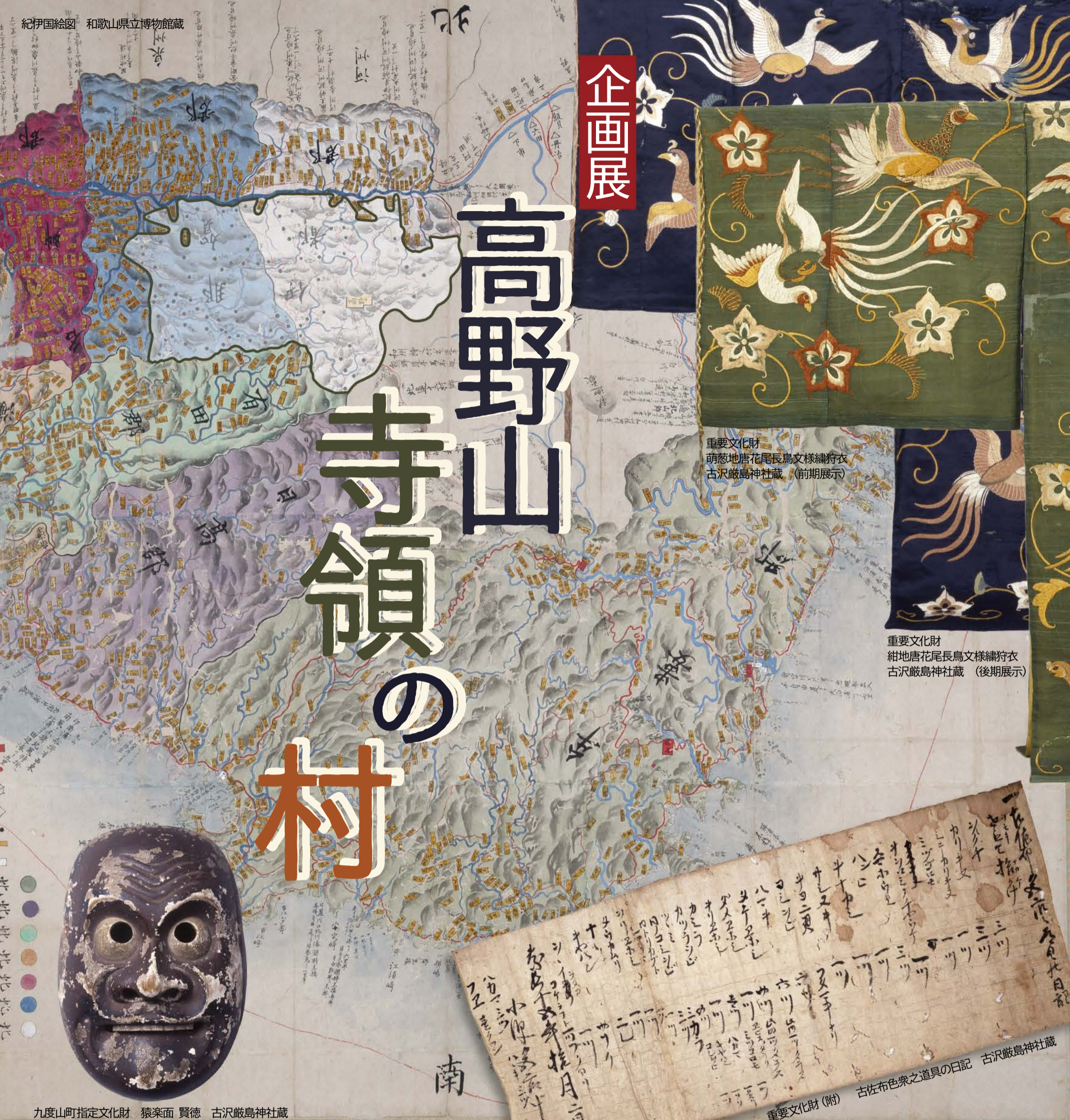
重要文化財 萌葱地唐花尾長鳥文様繡狩衣 古沢巖島神社蔵 (前期展示)