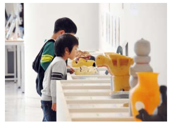
(協力:県立和歌山工業高校・県立和歌山盲学校)

エントランスホールと常設展示室には、文化財のかたちを手に取って体験できるレプリカを置いてあります。どうぞ、自由にさわってみてください。