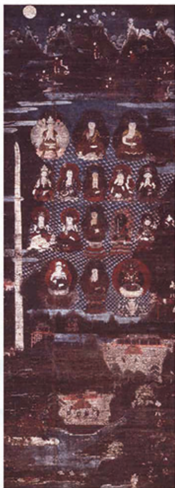
和歌山県指定文化財 熊野本地仏曼荼羅(青岸渡寺蔵)