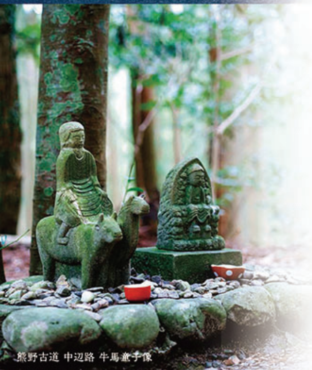
熊野古道 中辺路 牛馬童子像