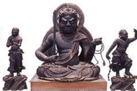
不動明王坐像および二童子像(東光寺蔵)