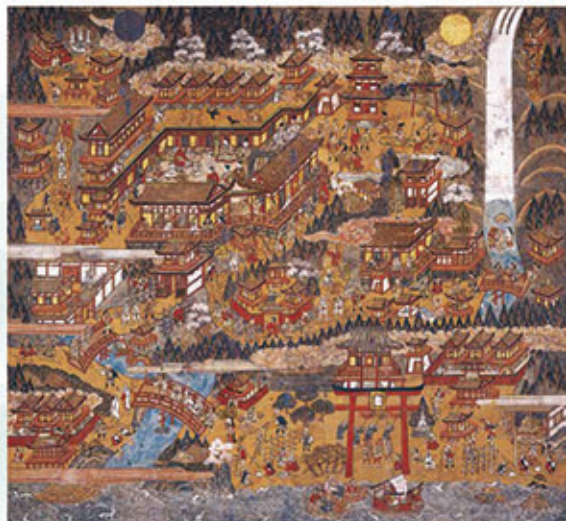
和歌山県指定文化財 熊野那智参詣曼荼羅(熊野那智大社蔵)

熊野三山のうち、現在もなお唯一神 仏習合の景観を今に留めている那 智山（熊野那智大社と青岸渡 寺）。そして、その信仰の象徴・源泉 とも見られる那智瀧。熊野那智山 に顕れた神仏、そこで執り行われる 祭礼、信仰を広めた御師の活動な どを通じて、熊野信仰の成り立ち と広がりについて展示します。