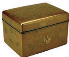
国宝 古神宝類のうち桐唐草蒔絵手箱(熊野速玉大社蔵)