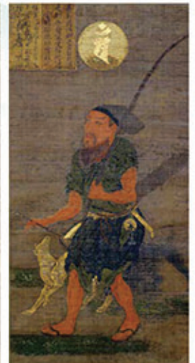
重要文化財 丹生明神像・狩場明神像(金剛峯寺蔵)