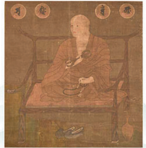
紀美野町指定文化財 弘法大師像(遍照寺大師講蔵)