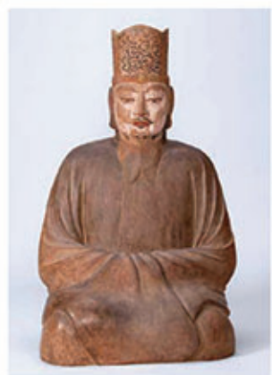
国宝 熊野速玉大神坐像(熊野速玉大社蔵)