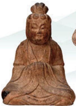
和歌山県指定文化財 女神坐像(龍谷寺蔵)