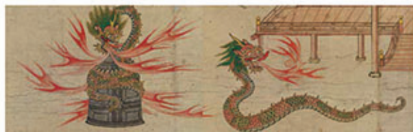
重要文化財 道成寺龍起下巻(道成寺蔵)