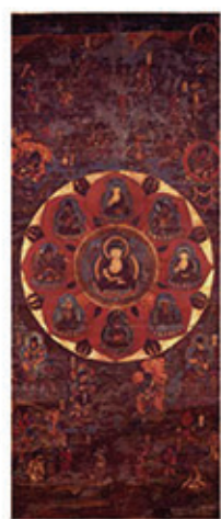
和歌山県指定文化財 熊野本地仏曼荼羅(熊野本宮大社蔵)