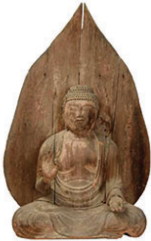
和歌山県指定文化財 阿弥陀如来坐像(高加区蔵)

高野山は真言密教の聖地であり、祖師・弘法大師空海が祀られるとともに、地主神丹生明神も祀られ、神仏が共存する山として位置しています。聖地・高野山の複雑で豊饒な信仰と宗教文化を紹介し、あわせて高野山の影響なども受けながら育まれた、高野山麓に広がる豊かな宗教文化もあわせて取り上げます。