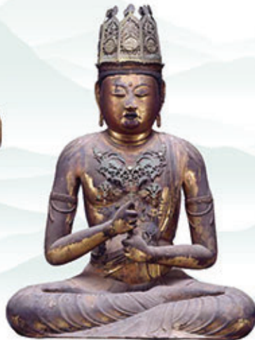
重要文化財 大日如来坐像 (旧勸学院本尊)(金剛峯寺蔵)