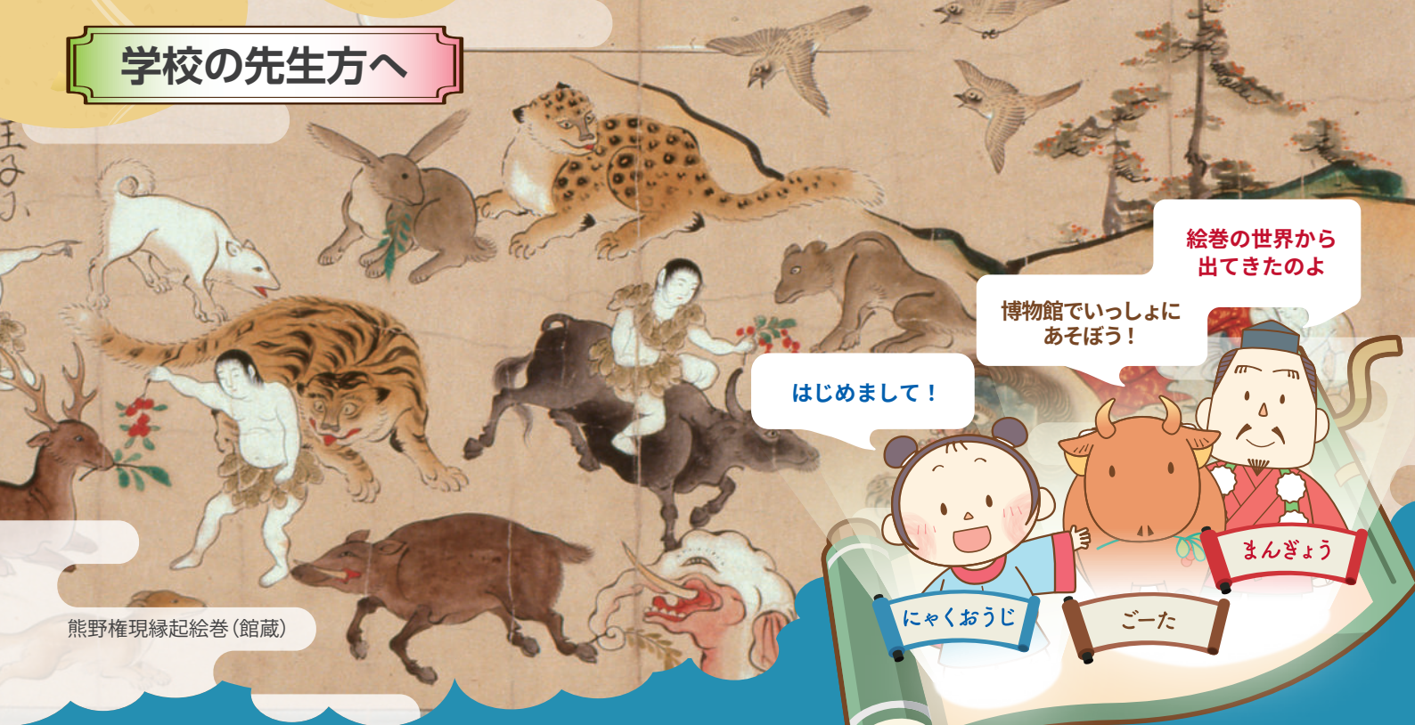
熊野権現縁起絵巻 (館蔵)