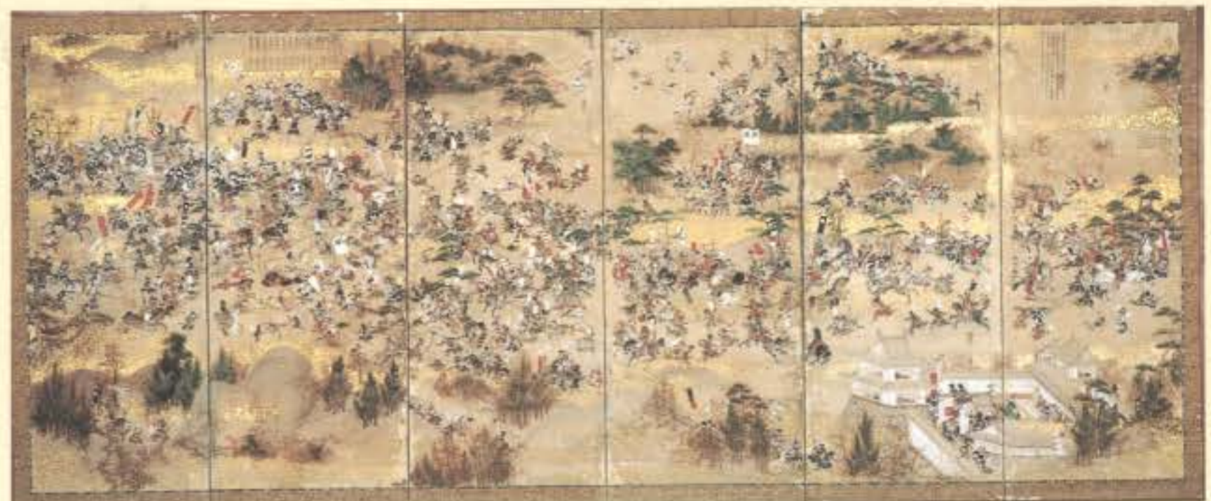
紙本著色 紀州本川中島合戦図屏風 六曲一双のうち右隻（館藏品）

昨年当館が購入した「紀州本川中島合戦図屏風」を中心に、全国各地の戦国合戦図屏風の名品を集め、比較・観賞していただきます。紀州本のほか現存する二組の川中島合戦図屏風をはじめ、賤ヶ岳・長篠・関ヶ原・大坂の陣など、戦国時代の有名な合戦を描いた屏風を約四〇件展示・公開する予定です。会期中に、学芸員による講演会も予定しています。ぜひご期待ください。