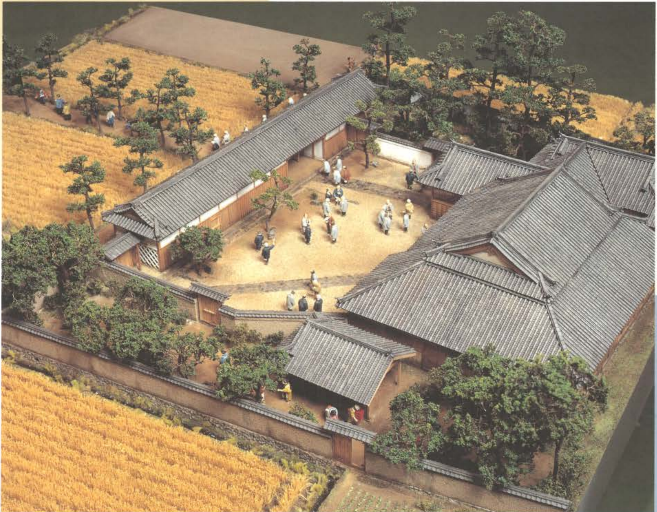
増田家住宅復元模型（常設展 近世ゾーン）