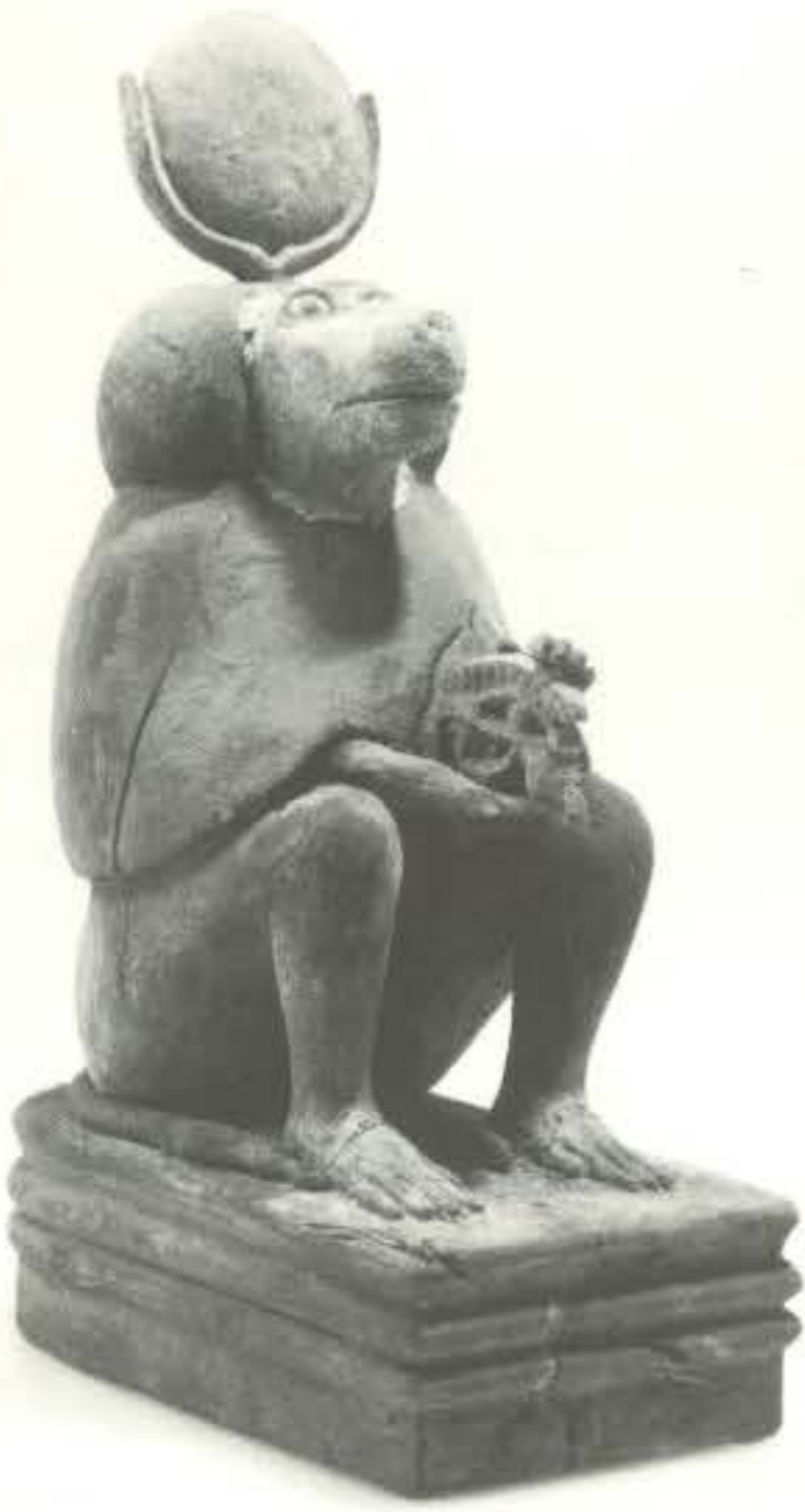
ホルス神の眼を捧持するヒヒ