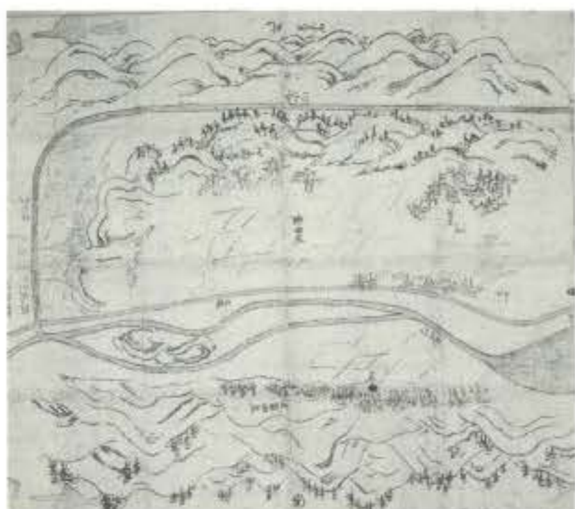
重要文化財 紀伊国栢田荘絵図 （宝来山神社蔵）