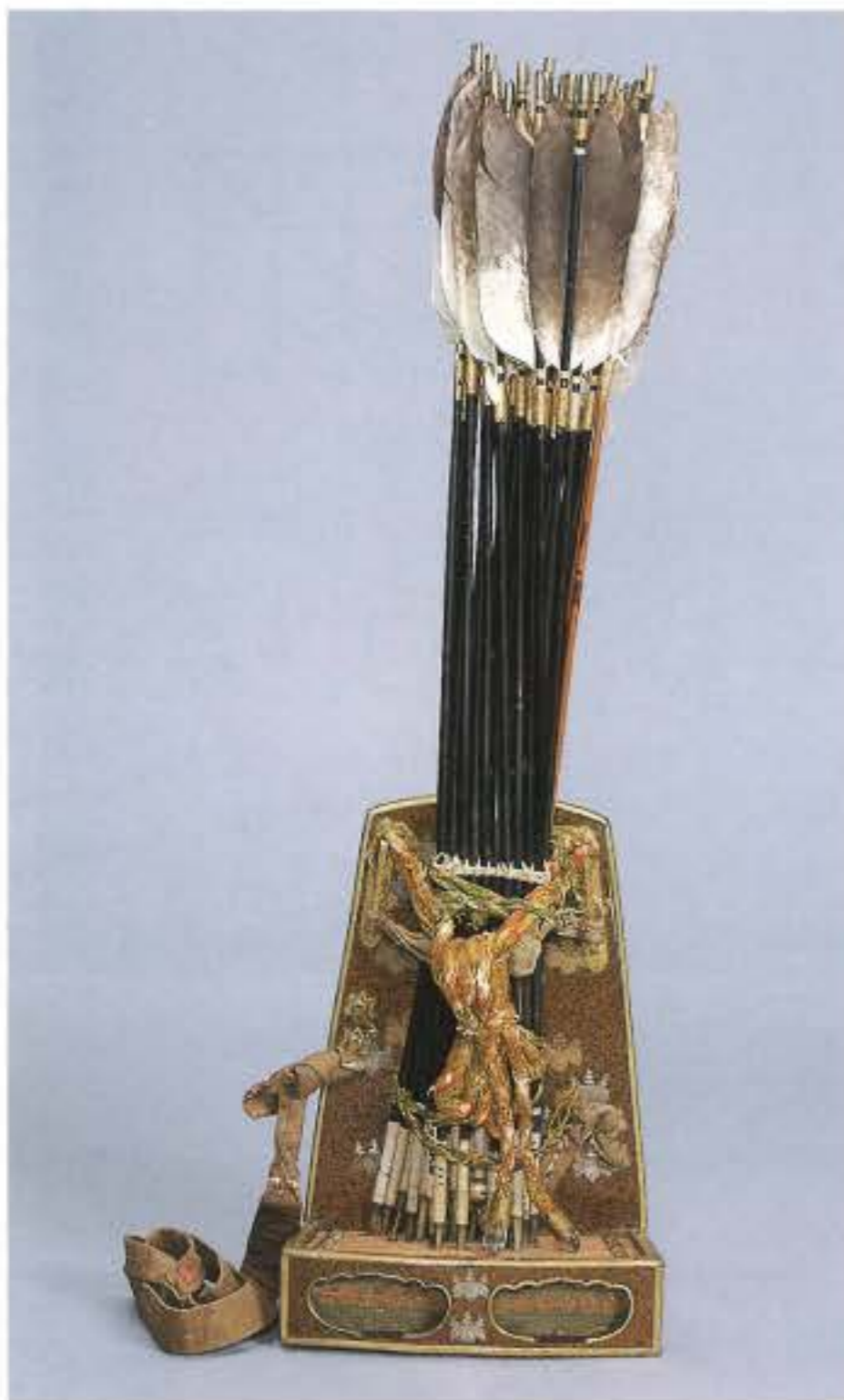
国宝 古神宝類のうち 桐文蒔絵平胡録・金銅鎗矢・金銅箭 熊野速玉大社蔵

この特別展は、新館開館一五周年を記念して、当館が寄託を受けている文化財のうち、国宝・重要文化財に限って、特別に公開するものです。普段はそろって展示することのない貴重な文化財を公開し、きのくに—和歌山県に残されている文化財の価値を、あらためて認識いただける機会となるものと思います。