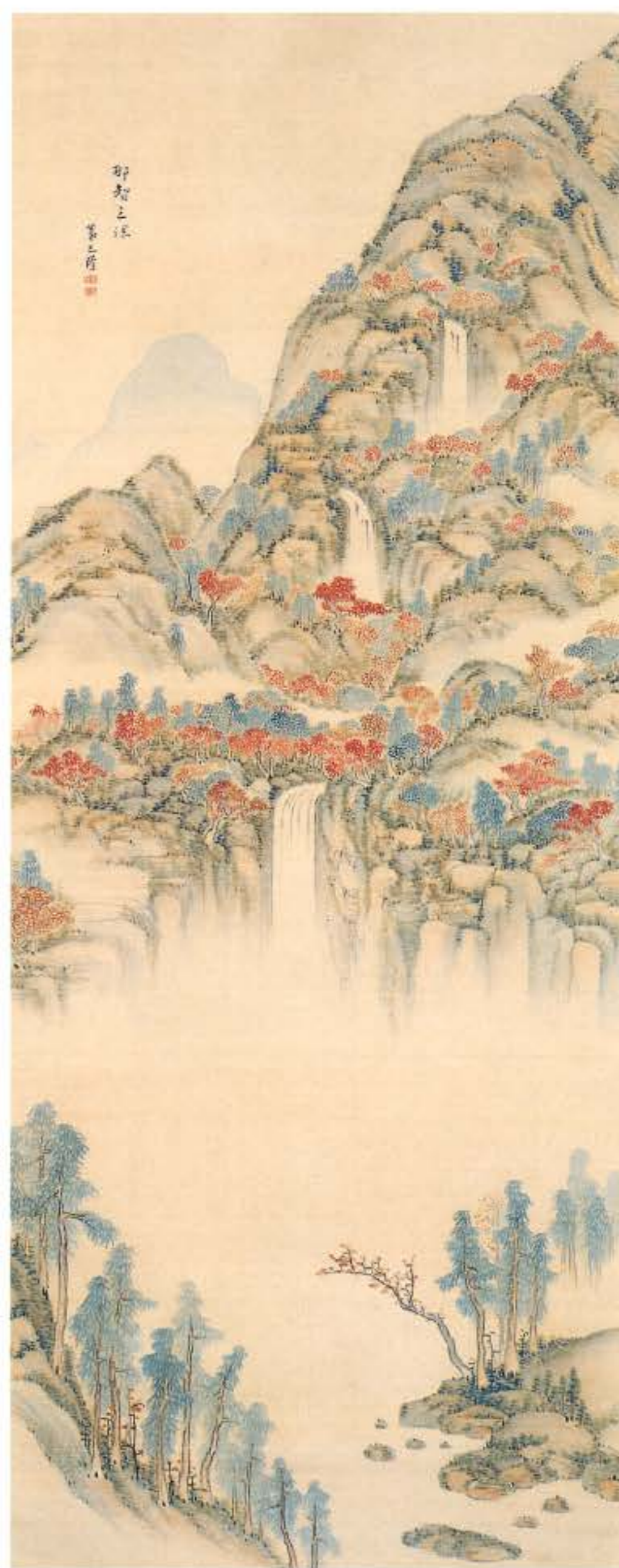
那智三瀑図 野呂介石筆 和歌山県立博物館蔵