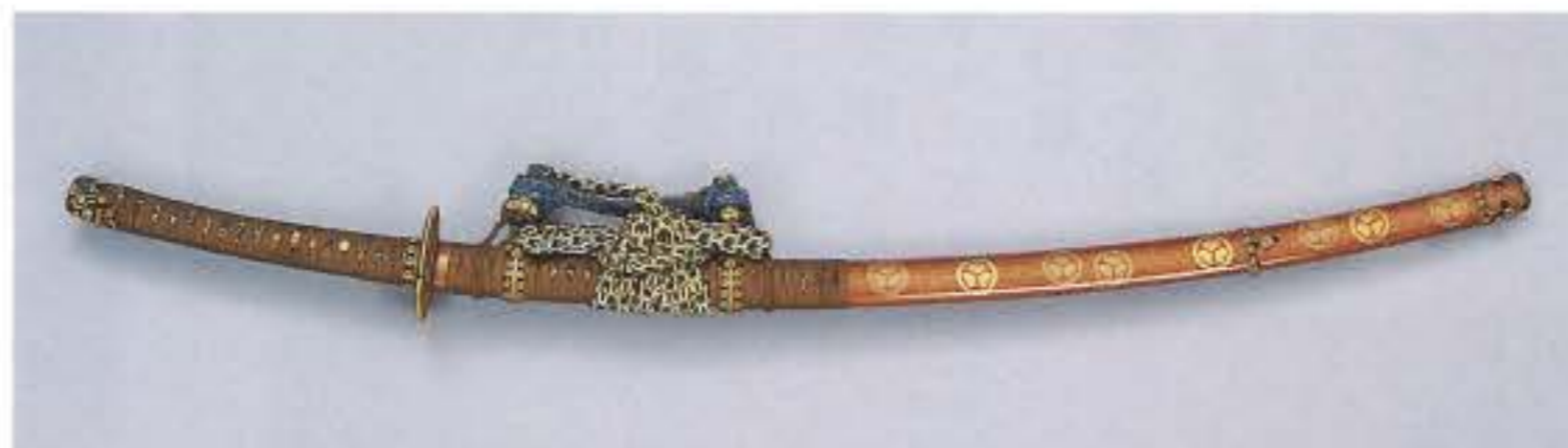
重要文化財 太刀 銘安綱 糸巻太刀拵 紀州東照宮蔵