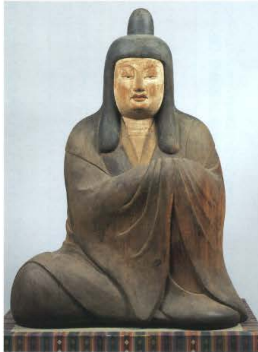
国宝 夫須美大神坐像 熊野速玉大社蔵