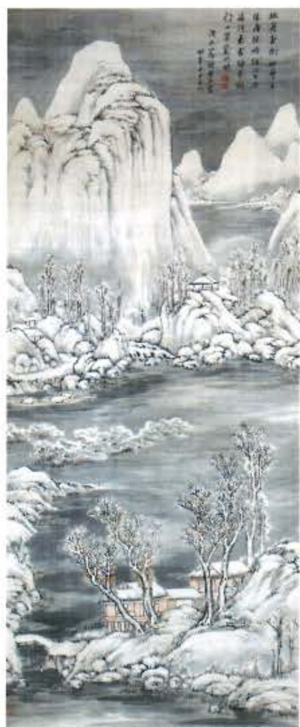
雪景山水図 野呂介石筆 個人蔵

紀州三大文人画家の一人で、江戸時代後期の画壇に大きな影響を与えた野呂介石(一七四七〜一八二八)。和歌山城下の町人の家に生まれた介石は、若くして京都へ出て池大雅(一七三三〜一七九六)に絵を学びます。寛政五年(一七九三)、四七歳の時に紀伊藩士へ取り立てられ、以後、公務のかたわら絵画制作を続けました。紀州の豊かな自然を題材に、優れた山水画を描いたほか、良質の中国絵画に学び、また多くの門人を育てています。この特別展では、彼の交友関係や画壇に果たした役割、新知見などふくめて、その画業を約三〇年ぶりに大規模にご紹介いたします。