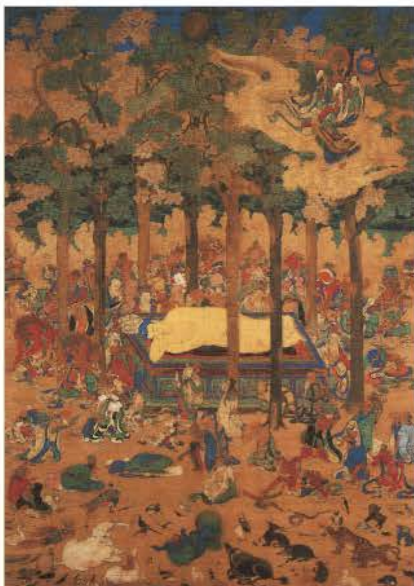
重要文化財 仏涅槃図 長保寺蔵