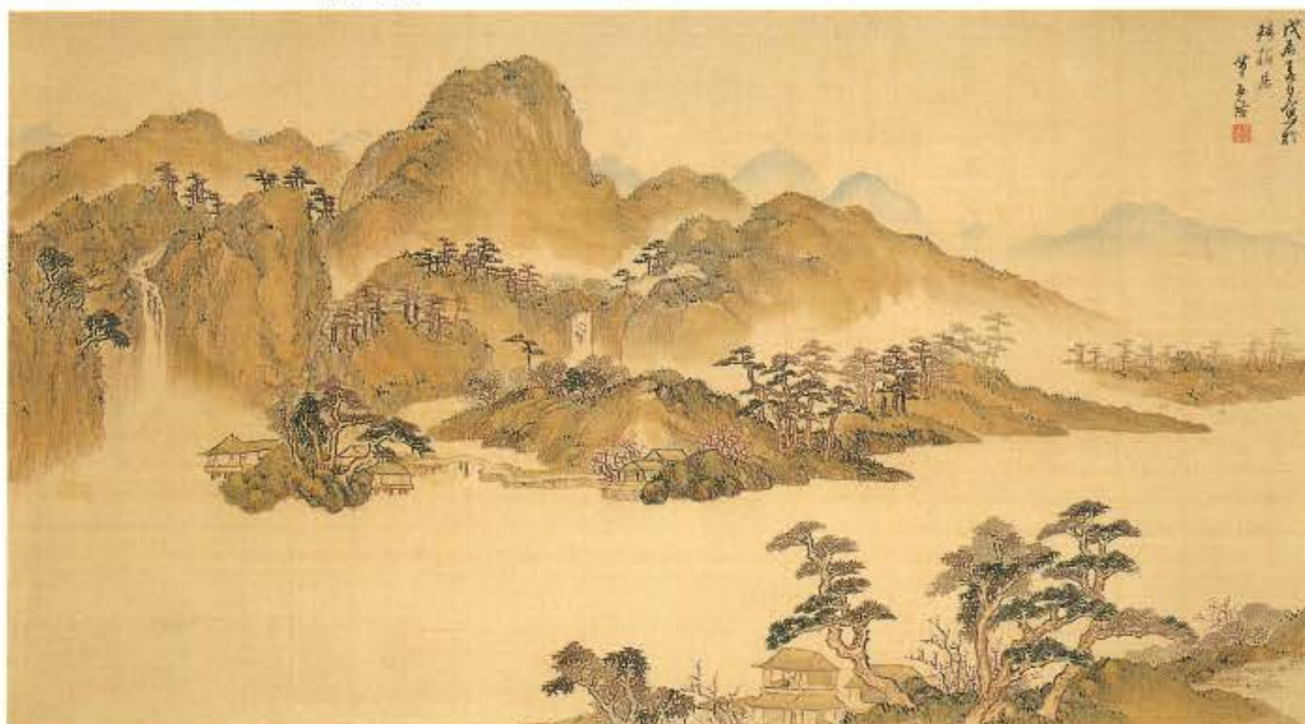
春景山水図 野呂介石筆 和歌山県立博物館蔵