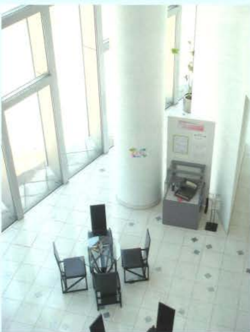
マイミュージアムギャラリーの様子

出品資格はありません。誰でも、自分の思い出の品を博物館にお持ち頂ければ、学芸員が「モノ」にまつわるお話をうかがって、思い出を展示へと作り上げていきます。出品をご希望される方やご興味がある方は、どうぞ博物館(〇七三―四三六一八六七〇)にお問い合わせ下さい。