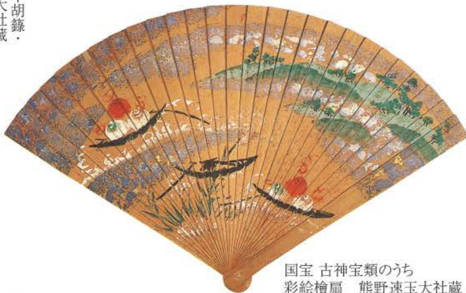
国宝 古神宝類のうち 彩絵檜扇 熊野速玉大社蔵