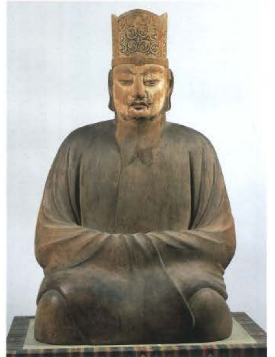
国宝 熊野速玉大神坐像 熊野速玉大社蔵