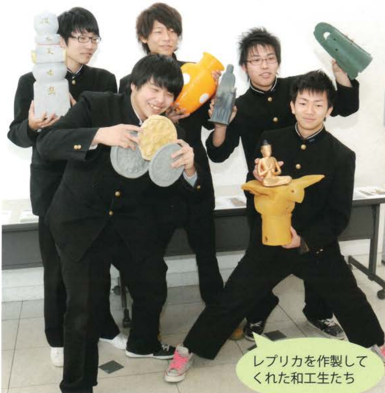
レプリカを作製してくれた和工生たち

い仮面のレプリカと、図録『仮面の世界へご招待ーさわって学ぶ和歌祭ー』を作製し、ロビーで常時展示しています（平成22年度文化庁美術館・歴史博物館活動基盤整備支援事業）。 そして平成23年度は常設展示の内容と関連させて、銅鐸や埴輪、瓦、仏