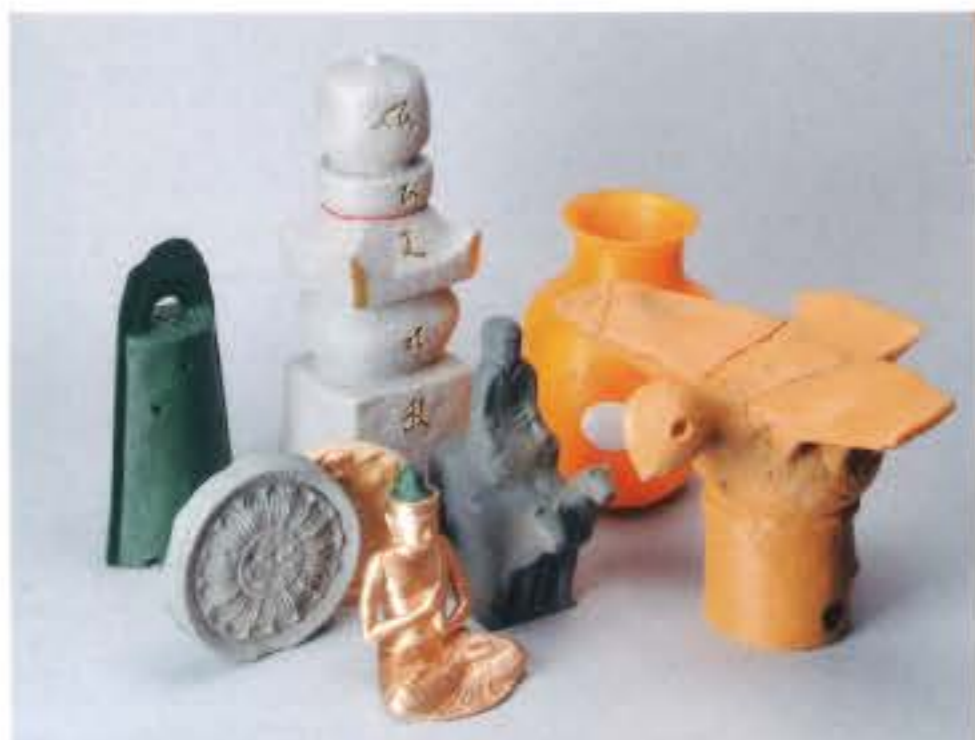
新たに作製した触れるレプリカ7種類。きのくにの祈りがテーマです。点字パネルや触って読む図録もあります。

展示では「かんたん解説」など分かりやすい解説パネルの設置を心がけ、また専用機器による音声ガイドを学芸員自身が毎回作製し、全ての展覧会で用意しています。