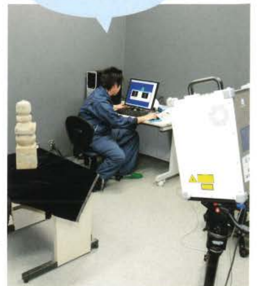
文化財のレーザー計測の様子

これは博物館のユニバーサルデザイン化を推進するため、最も情報が届きにくい人へと向けて展示を構築することで、見える人も、見えない人も、見えにくい人も、ともに博物館を楽しんで利用していただくための取り組みです。