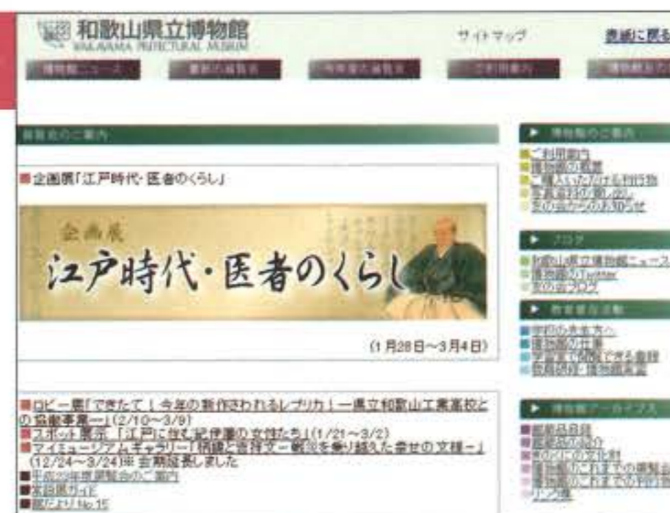
ホームページで様々な情報にアクセス! http://www.hakubutu.wakayama-c.ed.jp/

博物館の利用者は、実際に施設に足をお運びいただいた方だけでなくありません。例えば電話などで頂いた和歌山の歴史に関するお問い合わせにお答えした写真の貸し出しも頻繁に行っています。 博物館のホームページに訪問してくださったお客様もまた利用者です。そこでは展覧会やイベントの情報提供にとどまらず、ブログ形式の「和歌山県立博物館ニュース」では博物館の日々の活動をリアルタイムにお知らせしたり、和歌山の歴史に関するコラムを頻繁に掲載しています。ツイッターによる細かな情報提供も行い、博物館を身近に感じていただけるよう、日々充実を図っています。更なる進化をご期待下さい。