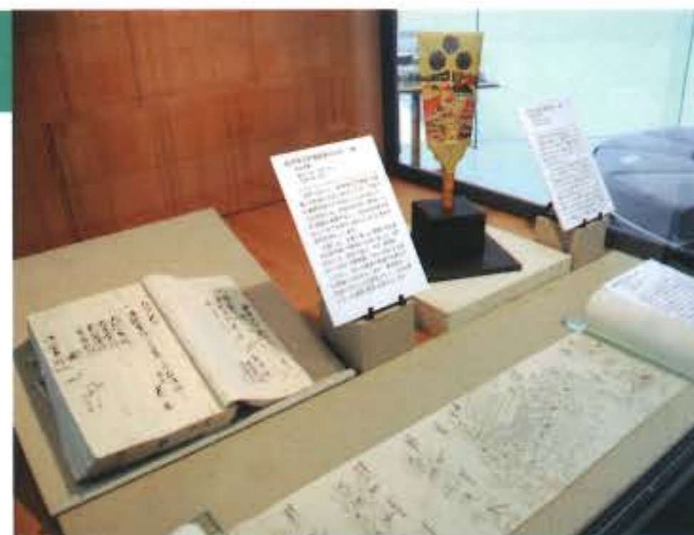
博物館の多様なコレクション。収蔵庫で眠らせず、その魅力を広く共有したい。学芸員の資料を見る視点にもご注目。

約1万点の館藏品は、常設展・特別展・企画展だけでは公開の機会が限られますので、こうした展示を通じて、博物館のコレクションをご紹介します。