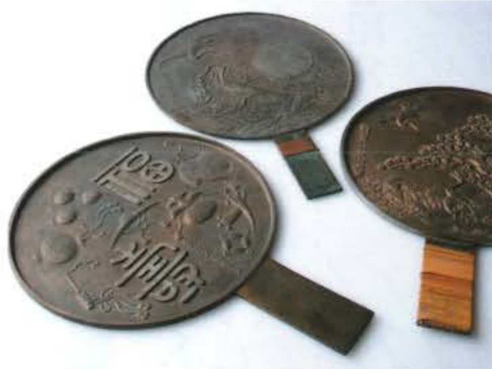
第28回展示「柄鏡と吉祥文」で展示した資料。展示してみたい!という方は、お気軽にお問い合わせ下さい。

昔遊んだおもちゃ、海岸で拾った石、お正月に使っている重箱など、一見なにげないものでも、それにまつわる思い出とともに見ると見え方が変わり、かけがえのないものであることに気づきます。誰でも出品できる市民参加型のこの展示にぜひ参加してみてください。高価な物、珍しい物である必要はありません。学芸員が思い出を取材して、ともに展示を作り上げ、思い出が光り輝くその瞬間を迎えたいと思います。