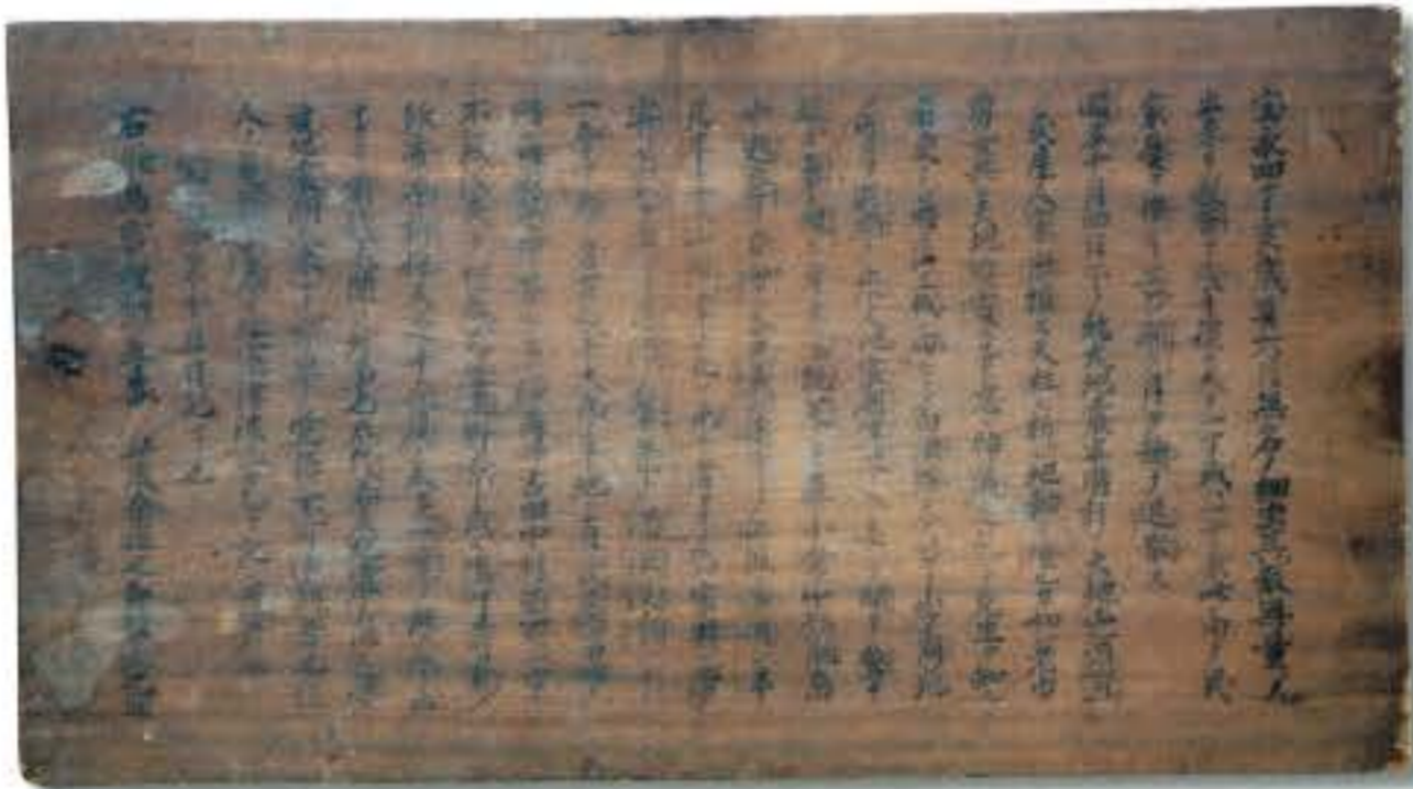
津波警告板 日神社蔵 (和歌山県指定有形民俗文化財)

この特別展では、まず先人たちが残してくれた文化財から、過去の災害を振り返ります。そのうえで、豪雨に伴う水害、近い将来起こるとされる南海地震・東南海地震とそれに伴う津波、こうした災害に対して、地域の文化財をどのようにして守ればいいのか、これまで行われた文化財のレスキュー活動から考えてみたいと思います。